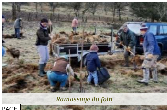
Ramassage du foin

Après trois années d'existence, le projet, grandit, et s'alimente des contributions de chacun.