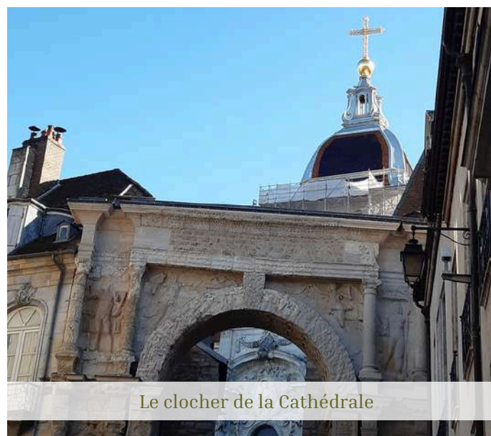
Le clocher de la Cathédrale