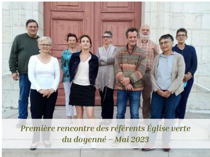
Première rencontre des référents Église verte du doyenné – Mai 2023