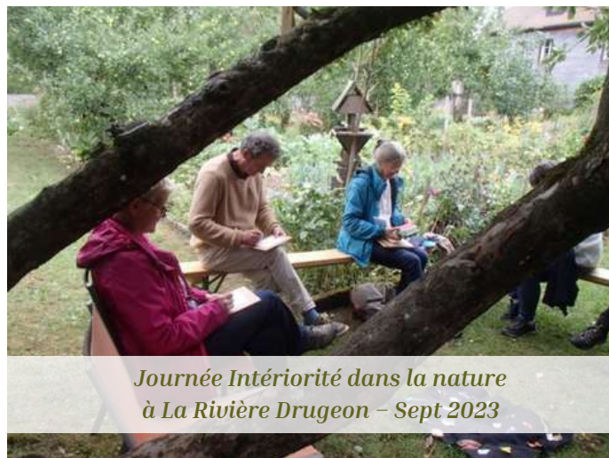
Journée Intériorité dans la nature à La Rivière Drugeon – Sept 2023

Pour le carême 2024, le film documentaire KTO Le ciel et la terre a été projeté devant une soixantaine de personnes lors d'une soirée bol de soupe. Après des échanges fructueux autour