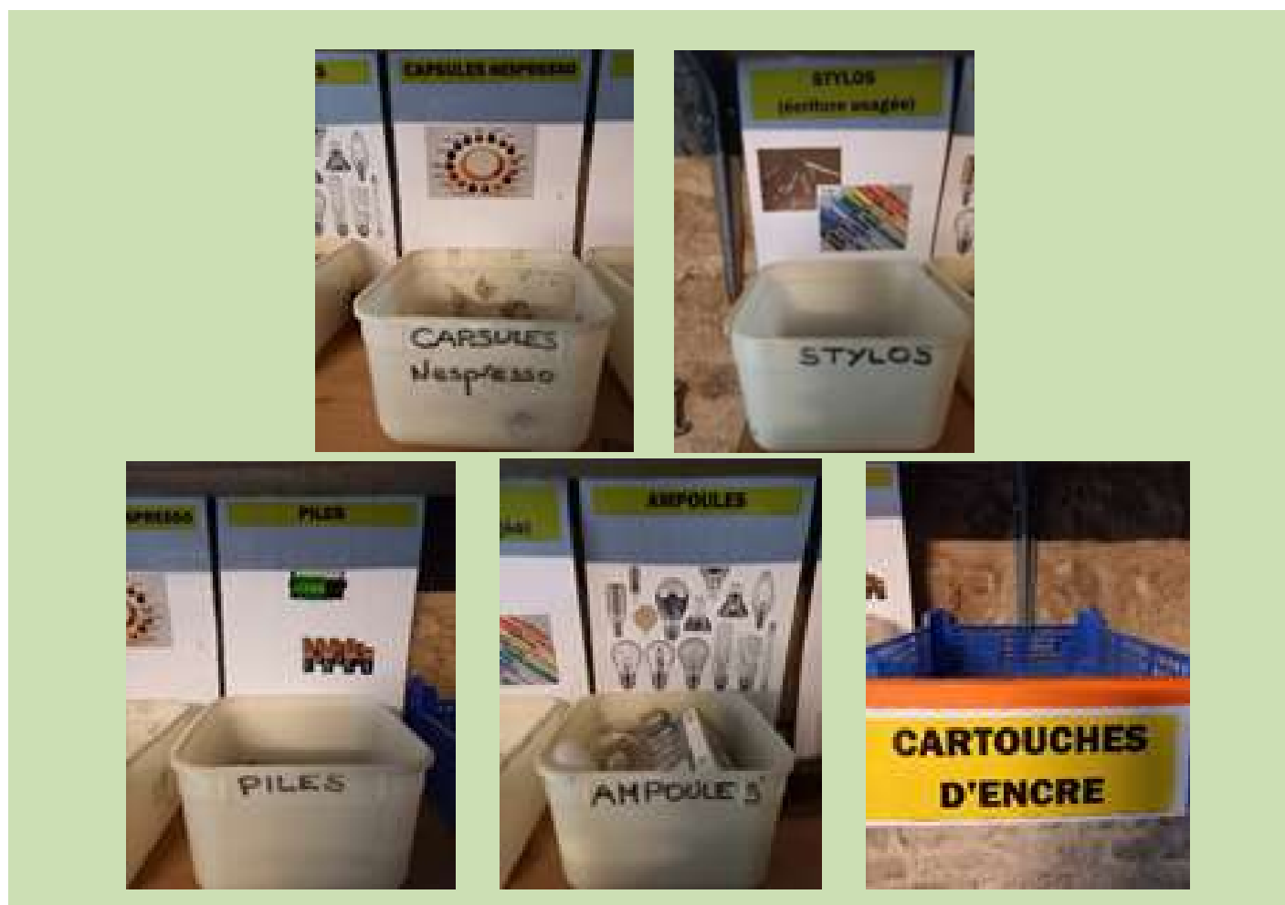
Bacs de tri à l'Archevêché

Aujourd'hui, en raison des emplois du temps trop remplis des uns et des autres, l'équipe est en pause.