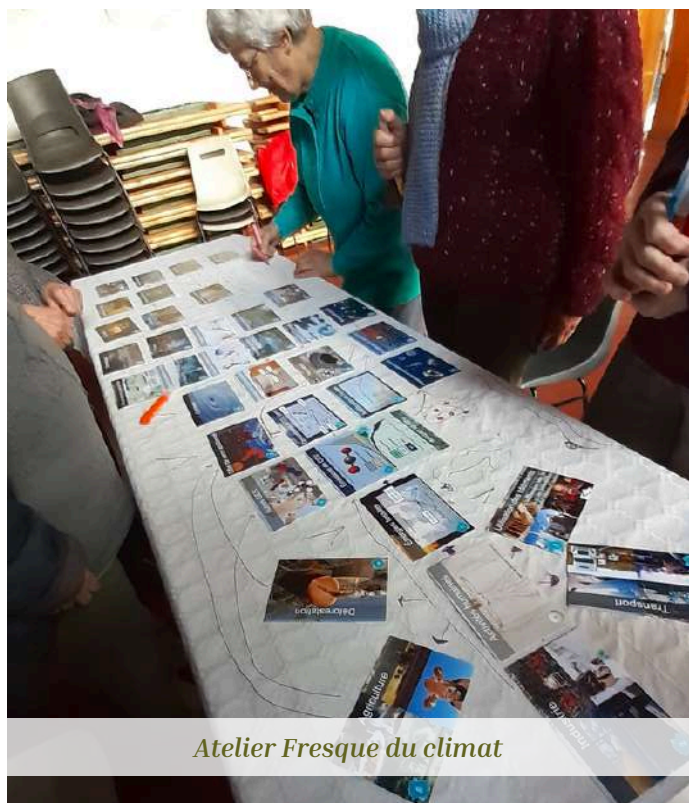
Atelier Fresque du climat