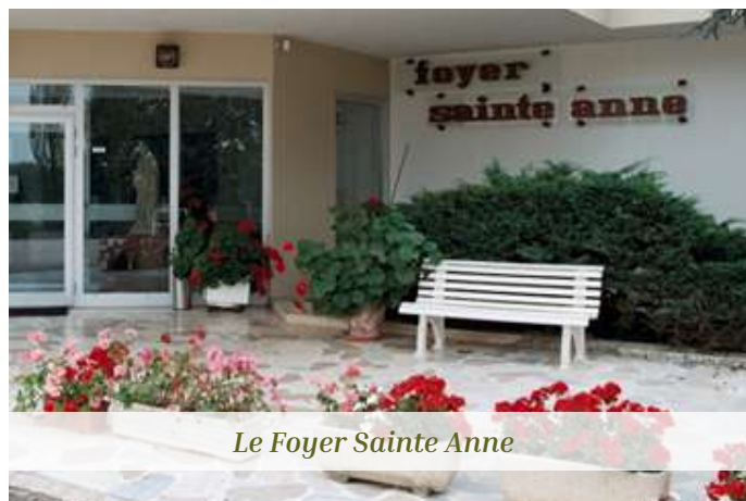
Le Foyer Sainte Anne

jour en 2023, dont une bénévole s'occupe. Il permet d'avoir quelques légumes servis ponctuellement pour la restauration.