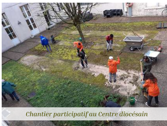
Chantier participatif au Centre diocésain

Une commission « économies d'énergie » s'est réunie en mars afin de réfléchir à comment mieux sensibiliser de façon concertée à la sobriété énergétique dans toute la maison. Née