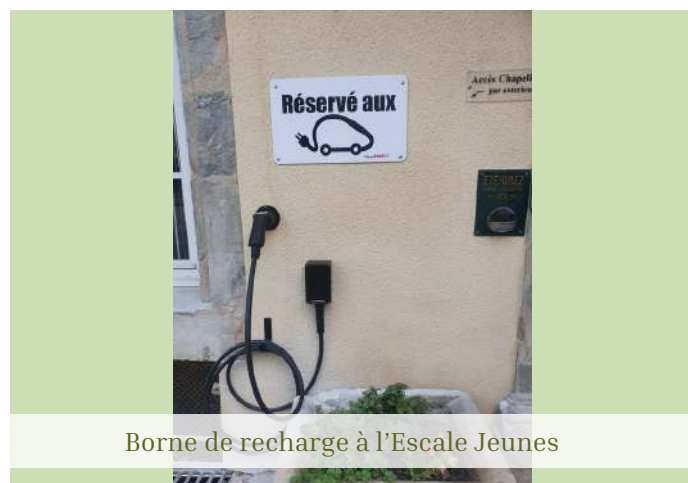
Borne de recharge à l'Escale Jeunes

Ce projet est un choix au long court, exigeant, certes, mais c'est avant tout à nos yeux, un choix nécessaire, motivant et responsable.